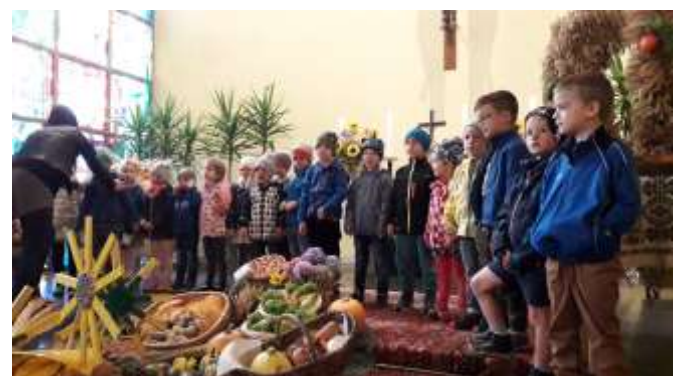
Erntedankfest unseres Kindergartens

Heuer wurden coronabedingt alle Feste und Veranstaltungen abgesagt, der Flohmarkt konnte nicht stattfinden (der nächste Flohmarkt ist am 9.10. und 10.10.2021 geplant). Auch die geplante Fortsetzung der Haussammlung und die anstehende Firmensammlung mussten ausbleiben. Daher finden Sie als Beilage in diesem Kirchenboten einen Erlagschein mit der Bitte um eine Spende für die neue Orgel. Vielen Dank im Voraus für Ihre Unterstützung!