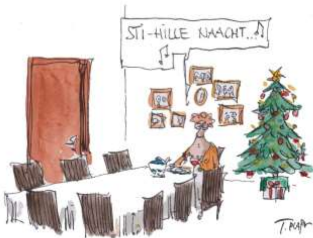
WIR SCHAFFEN DAS