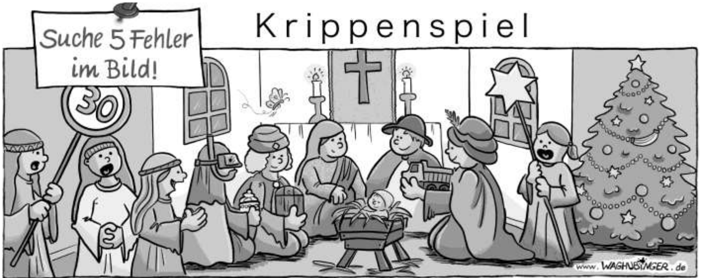
Verkehrsschild, Schmetterling, Schnorchel, Lastwagen, Banane